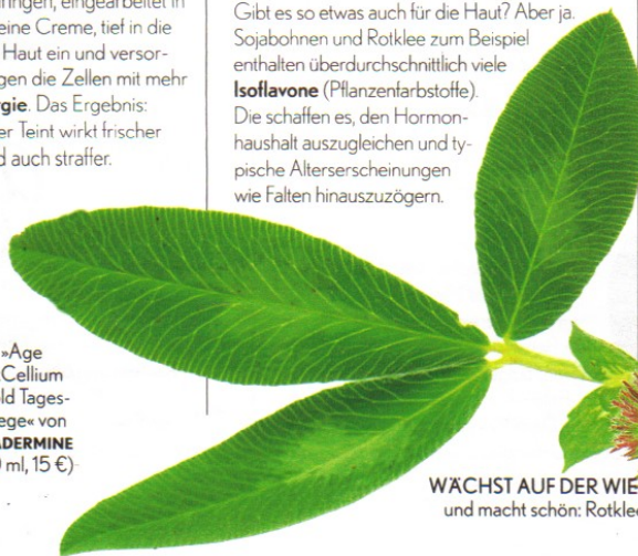
WACHST AUF DER WIESE und macht schön: Rotklee

Gibt es so etwas auch für die Haut? Aber ja. Sojabohnen und Rotklee zum Beispiel enthalten überdurchschnittlich viele Isoflavone (Pflanzenfarbstoffe). Die schaffen es, den Hormonhaushalt auszugleichen und typische Alterserscheinungen wie Falten hinauszuzögern.