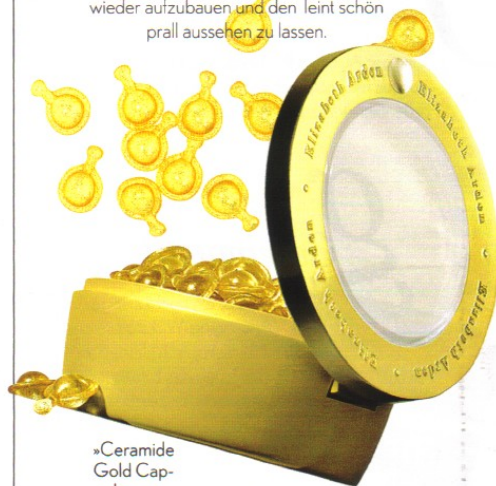
»Ceramide Gold Capsules« von ELIZABETH ARDEN (60 Stück, 84 €)

In der Hornschicht der Haut stecken Lipide, die ihre natürliche Barriere stärken und sie wieder aufbauen. Mit zunehmendem Alter wird diese schützende Fettschicht dünner und die Haut trockener. Abhilfe kommt aus den Beauty-Labors: Ceramide imitieren diese Lipide und helfen so, den Hautschutz wieder aufzubauen und den Teint schön prall aussehen zu lassen.