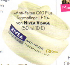
»Anti-Falten Q10 Plus Tagespflege LF 15« von NIVEA VISAGE (50 ml, 10 €)

Was verbirgt sich hinter der Bezeichnung »Coenzym Q10«? Die Antwort: eine körper-eigene Substanz, die in jeder Zelle vorkommt und eine große Rolle für deren Energiestatus spielt. Das ist gar nicht so kompliziert, wie es sich anhört: Die Hautzellen brauchen diese Energie, um Kollagen zu produzieren und um gut funktionieren zu können, damit die Haut glatt bleibt oder wird. Mit zunehmendem Alter nimmt das Q10 im Körper ab, deshalb muss es von außen zugeführt werden. Studien des Beauty-Konzern Beiersdorf haben gezeigt, dass die Verwendung von Produkten mit Q10 zu einer nachweisbaren Faltenreduktion führt.