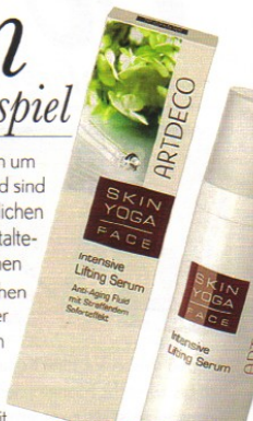
»Skin Yoga Face Intensive Lifting Serum« von ARTDECO (30 ml, 17 €)

Kleine Fältchen um Augen und Mund sind die ersten untrüglichen Zeichen der Hautalterung. Sie entstehen durch die natürlichen Bewegungen der Gesichtsmuskeln beim Lachen, Staunen, Weinen und Verlieben. Mit der Zeit werden diese Fältchen immer tiefer. Aber es gibt moderne Wirkstoffe wie synthetisches Schlangengift und Kresse-Extrakt, die die Muskeln entspannen und die Haut wieder glätten.