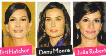
Teri Hatcher Demi Moore Julia Roberts