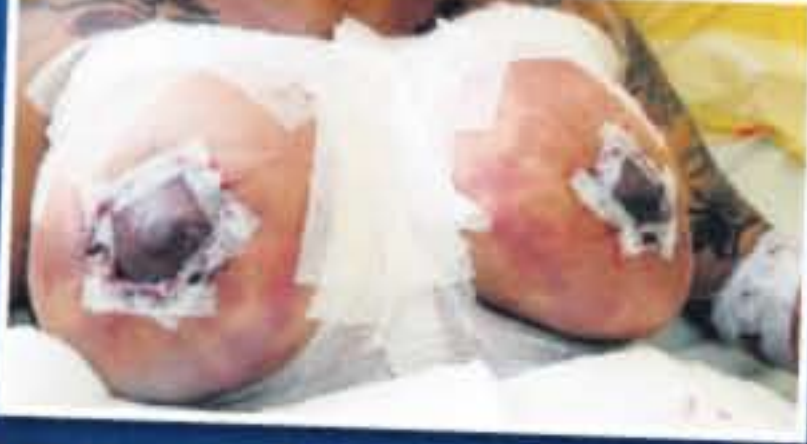
Nach der Horror-OP: Die Brüste sind bedagert. Die Brustwarzen stark geschwollen. Später starben sie wegen mangelnder Durchblutung ab